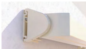
Design arrondi ou carré