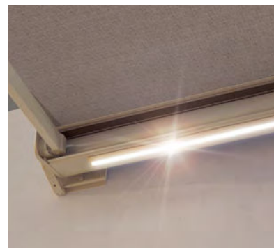
LED en option